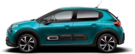
Spring Blue (parelmoer)