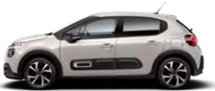
Soft Sand (parelmoer)