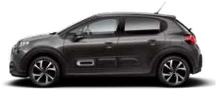
Platinum Grey (metallic)