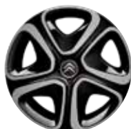
Staal 16" STEEL & STYLE 3D 205/55 R16V