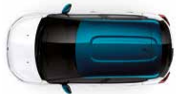
Two Tone Emerald