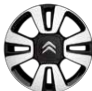
Lichtmetaal 16" Diamantée MATRIX 205/55 R16V