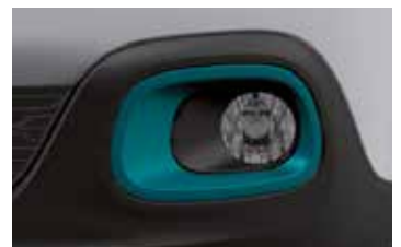
Pack Color Emerald