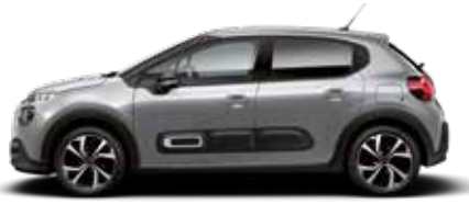
Steel Grey (metallic)