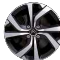
Lichtmetaal 17" Diamantée VECTOR 205/50 R17V