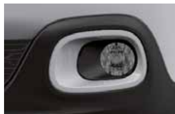
Pack Color Opal White