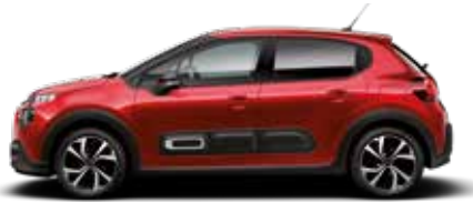
Elixir Red (parelmoer)