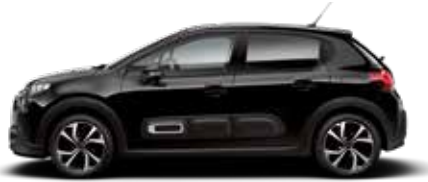
Perla Nera Black (parelmoer)