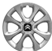
Staal 15" ARROW 185/65 R15H