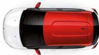
Two Tone Sport Red