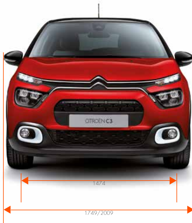
Breedte / Breedte met uitgeklapte buitenspiegels