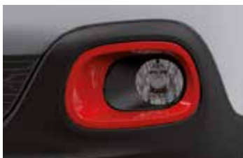
Pack Color Sport Red