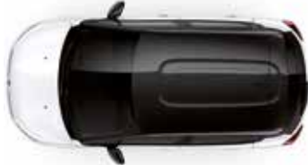
Two Tone Perla Nera Black