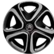
Staal 16" STEEL & STYLE 3D