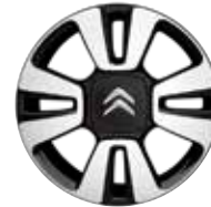
Lichtmetaal 16" Diamantée MATRIX