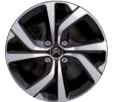
Lichtmetaal 17" Diamantée VECTOR