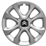
Staal 15" ARROW