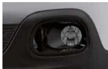
Two Tone Perla Nera Black