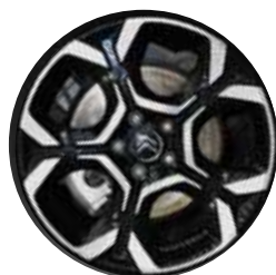
Lichtmetaal 18" PULSAR 225/55 R18