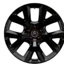
Lichtmetaal 19" ART Black 205/55 R19 225/50 R19